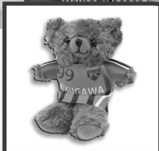
ユニフォーム ｸﾞﾏさん Uniform KUMASAN