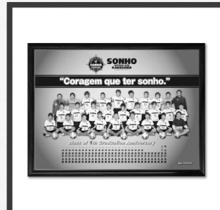
卒業・卒団パネル