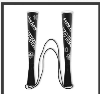
応援ツインメガホン