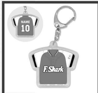
ユニフォームプレート