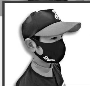
オリジナルマスク